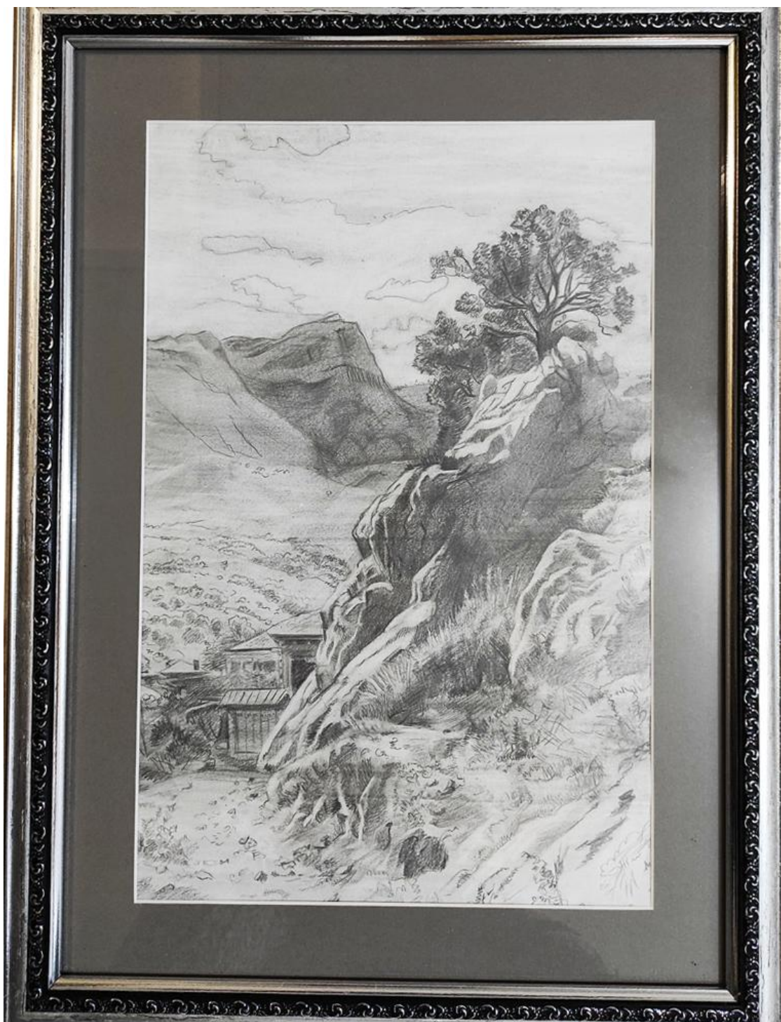
Рисунок 5 – Оформленная итоговая работа