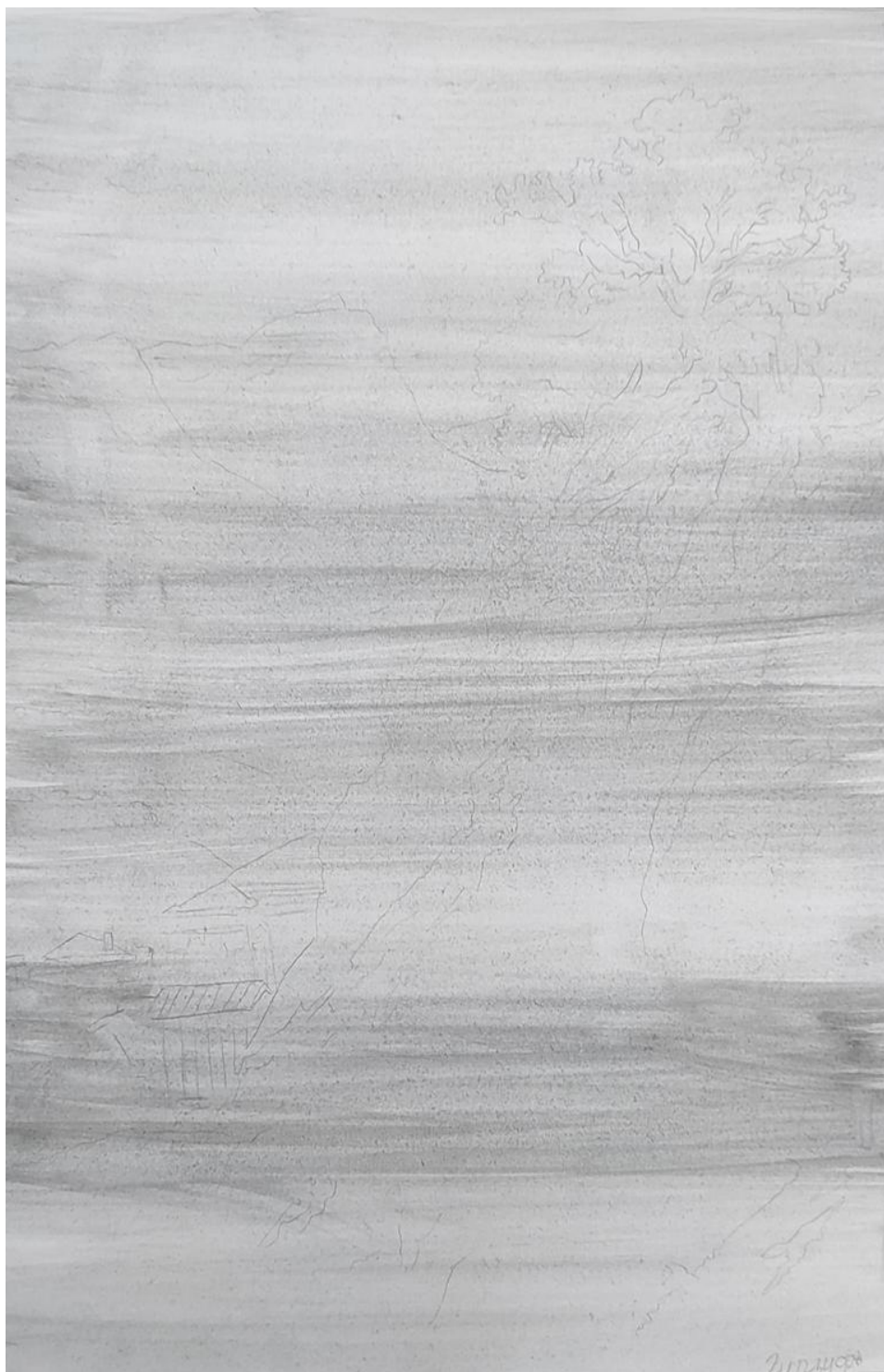
Рисунок 3 – набросок и нахождение композиции в листе