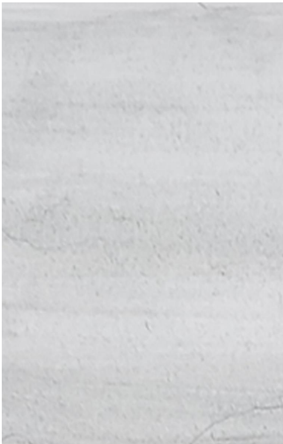
Рисунок 2 – бумага тонированная соусом