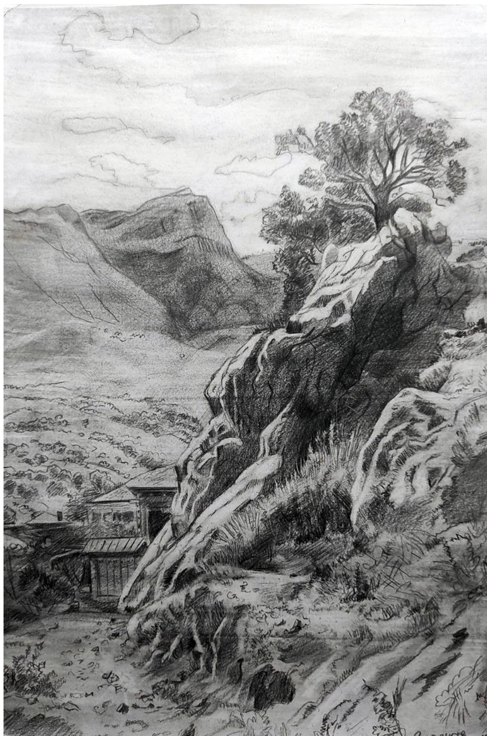
Рисунок 4 – Итоговая копия работы «В горах Гурзуфа» .И.И. Шишкина